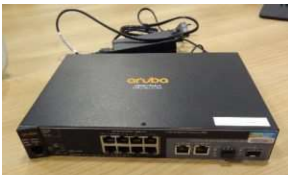
Afbeelding 3: Switch

Naast de draadloze verbindingapparatuur, plaats BreedLink een switch op uw locatie. De apparatuur blijft eigendom van BreedLink. Een voorbeeld van de switch vindt u in onderstaande afbeelding.